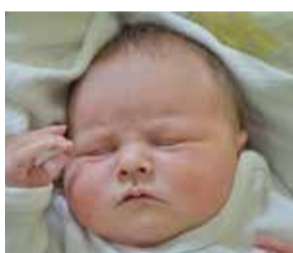
Paweł Bem 1 października 2015