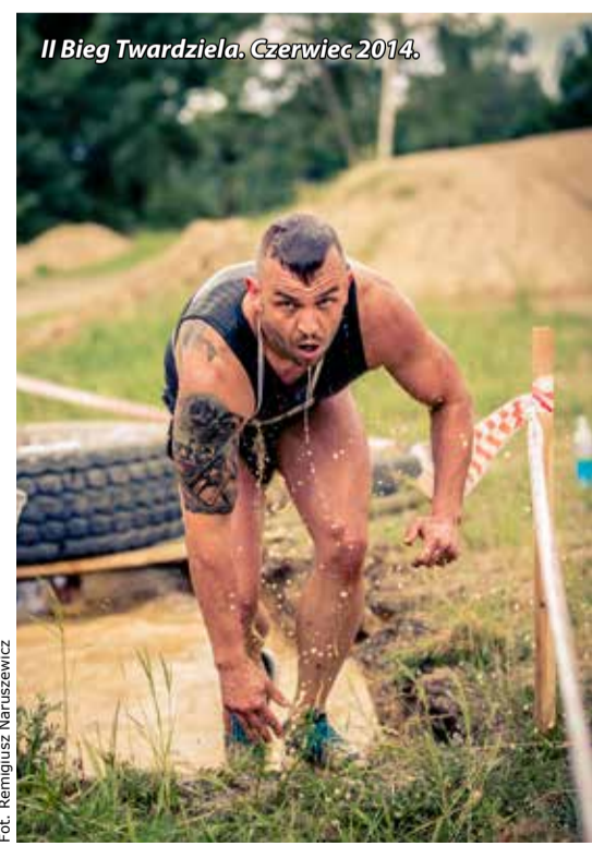
II Bieg Twardziela. Czerwiec 2014.

Staram się trenować codziennie, jeśli tylko czas na to pozwala. Sport jest ważny w moim życiu, ale muszę sobie tak układać dzień, by móc codzienne treningi łączyć z pracą zawodową. Nie ukrywam, że jest to trudne, ale możliwe do wykonania. Zdarza się, że są to trzy, cztery, a nawet sześć godzin w ciągu dnia. Moje treningi to zarówno bieganie, jeżdżenie na rowerze, a także zajęcia na sali, raczej unikam siłowni. Często też, bez względu na porę roku czy pogodę, wychodzę na dłuższe wyprawy. Szczególnie uwielbiam chodzić po górach. Mam nawet na koncie ta-