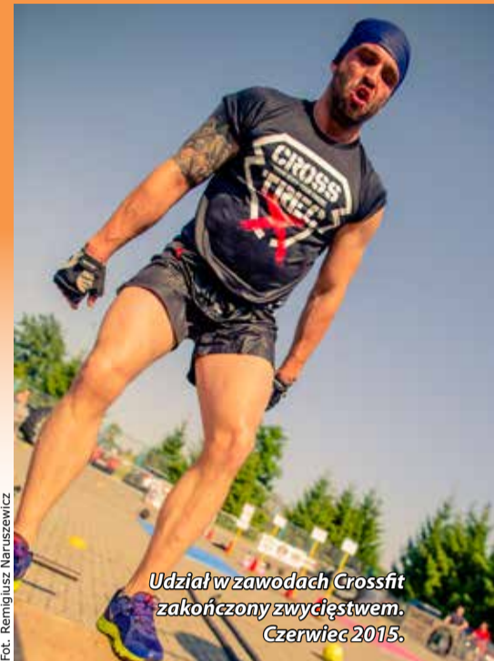
Udział w zawodach Crossfit zakończony zwycięstwem. Czerwiec 2015.

Chciałbym zachęcać innych ludzi do prowadzenia zdrowego stylu życia. W najbliższym czasie będę realizował kurs trenerski, który pozwoli mi pracować z ludźmi i trenować crossfit. Chciałbym bardzo, poprzez