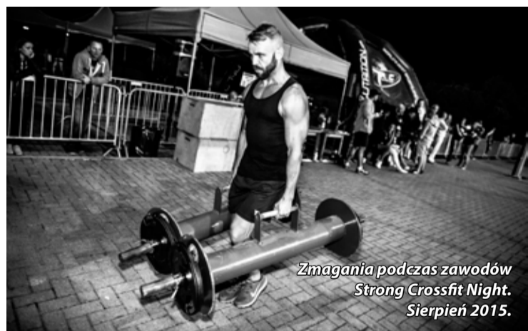
Zmagania podczas zawodów Strong Crossfit Night. Sierpień 2015.