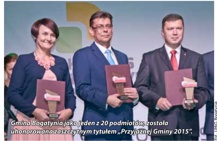
Gmina Bogatynia jako jeden z 20 podmiotów, została uhonorowana zaszczytnym tytułem „Przyjaznej Gminy 2015”.

Gmina Bogatynia jako jeden z 20 podmiotów, obok takich gmin jak: Koszalin, Zabrze, Je-